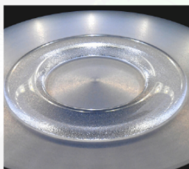
BEIGNET À L'EAU / © FILIP NOVKOSKI / MSC / CNRS PHOTOTHÈQUE

Permettre d'illustrer et de mettre en avant les travaux de nos recherches par l'image et non par des mots